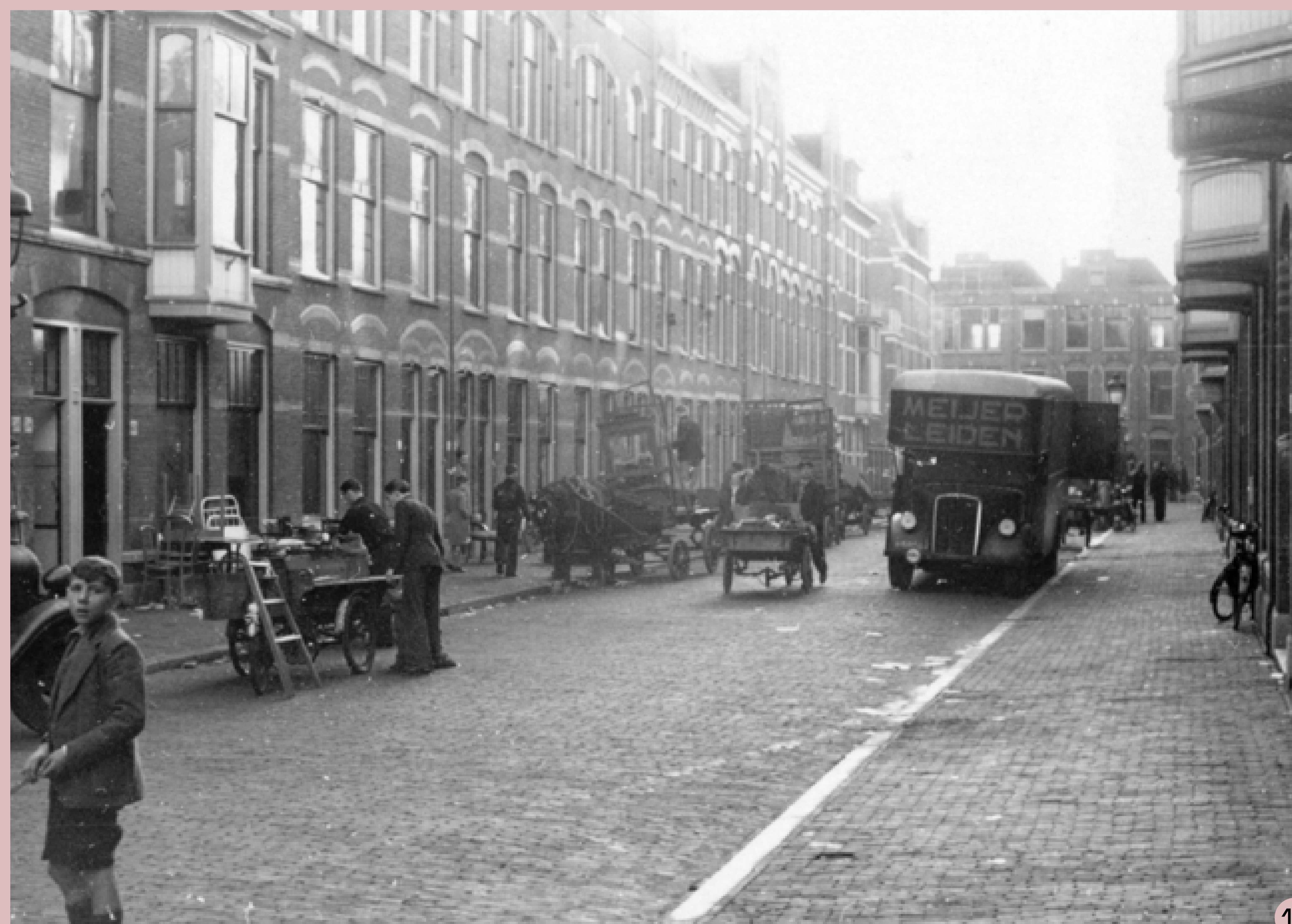
9 De schooltandarts Polygoon - Meyer