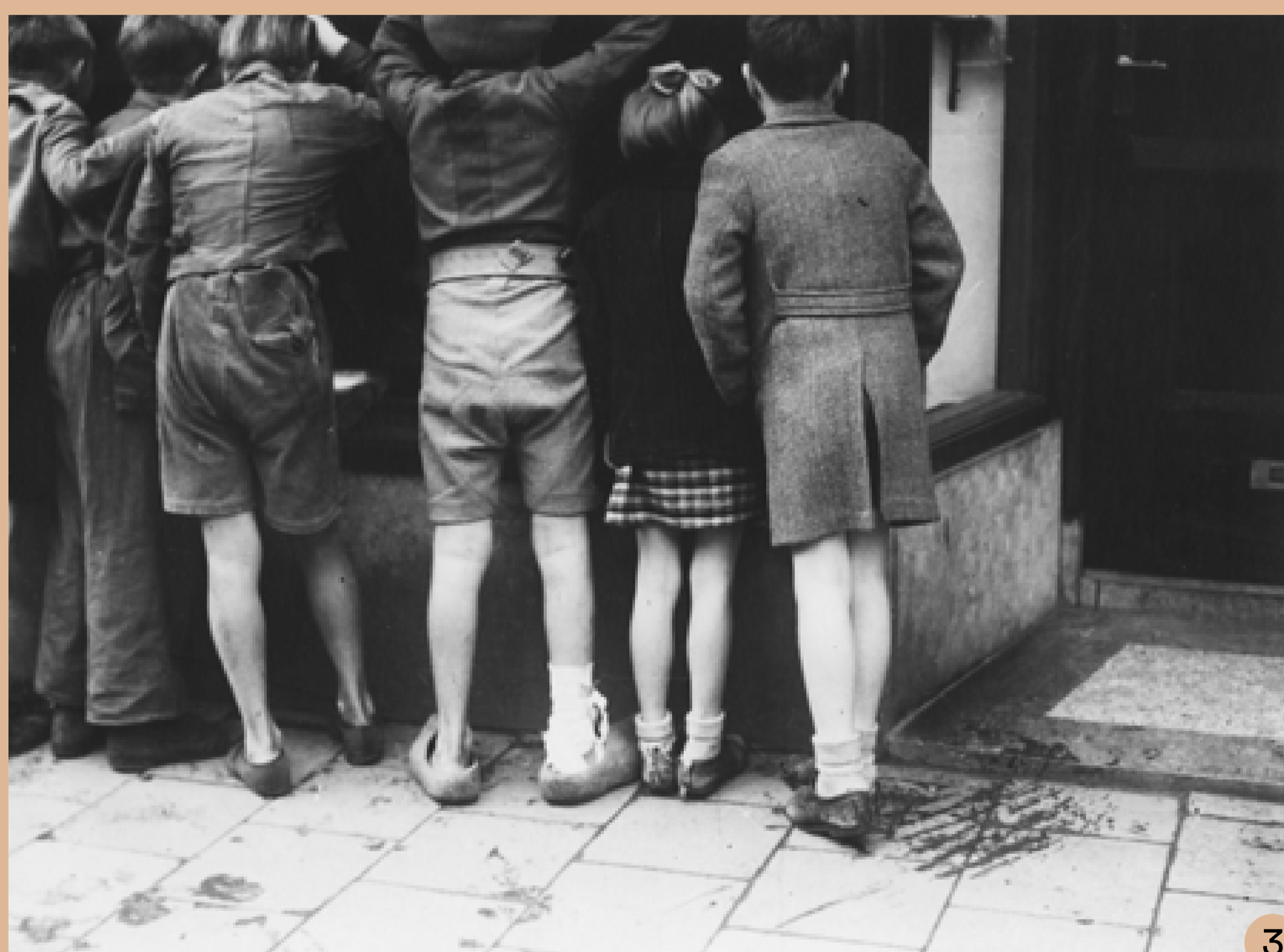
7 Wachtend op het eten van de gaarkeuken aan het Lange Voorhout Wouter van Gool