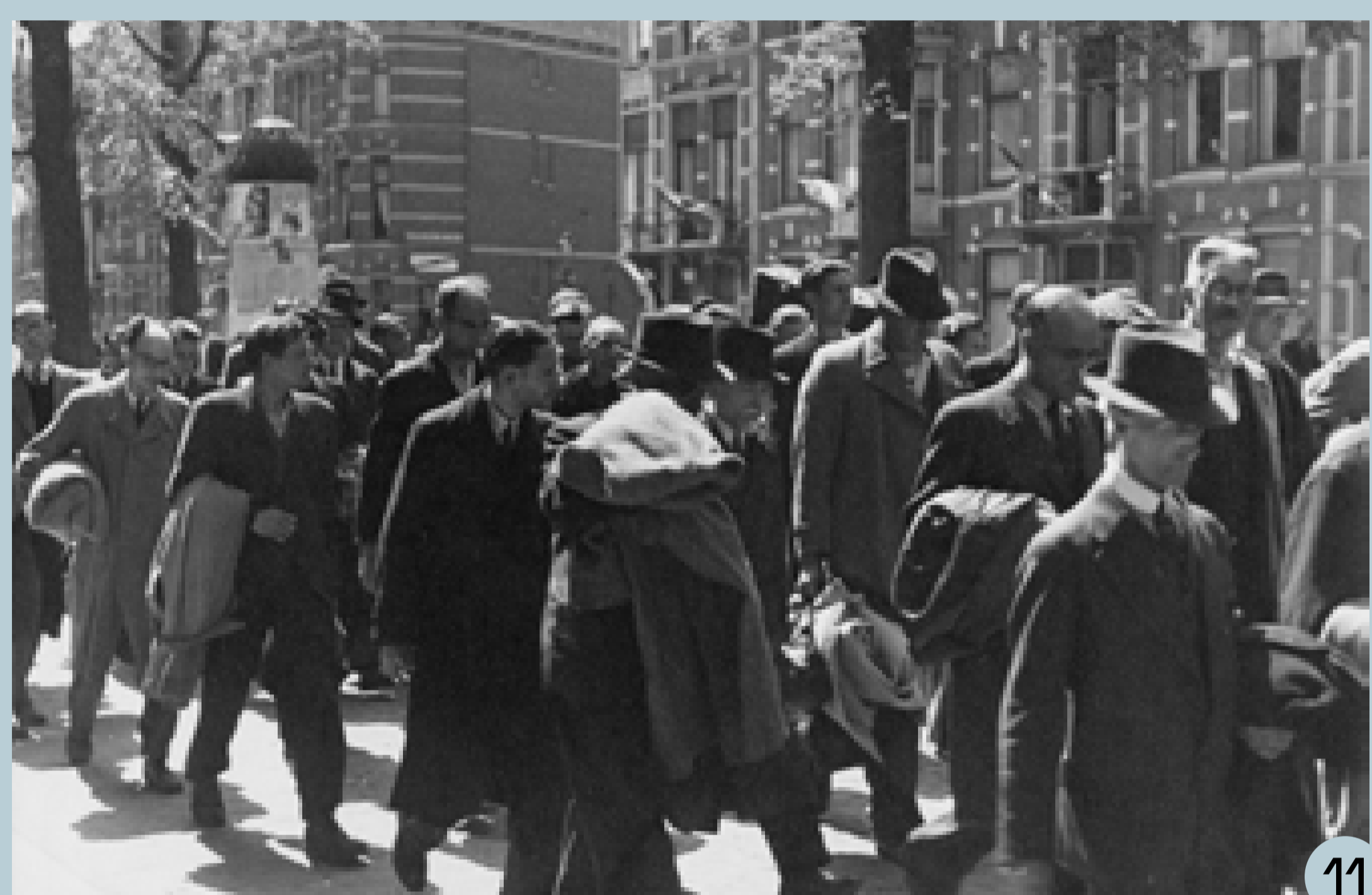
18 Arrestatie van Mussert