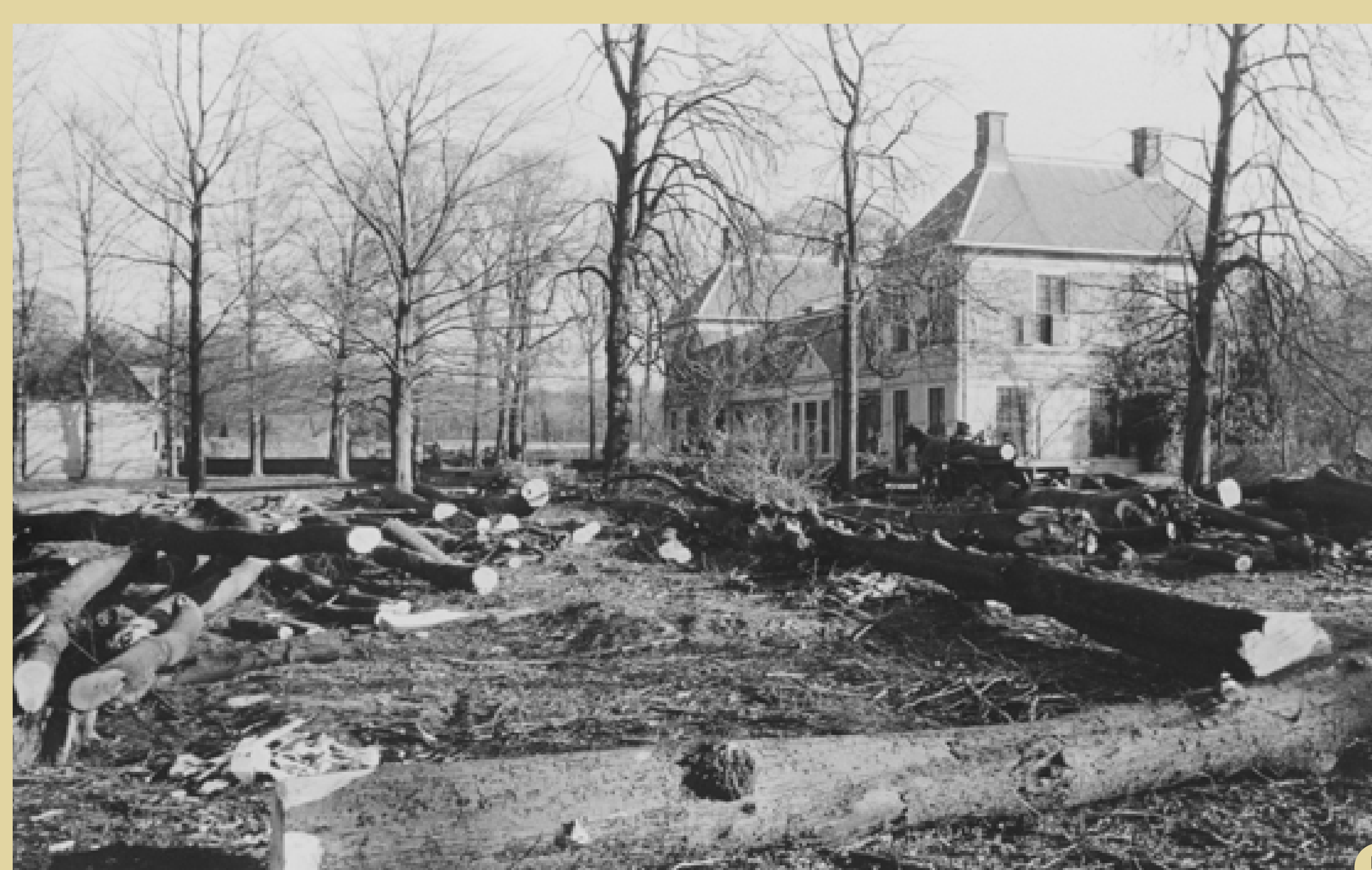
5 Gekapte bomen bij het Catshuis Adriaan Goekoop jr