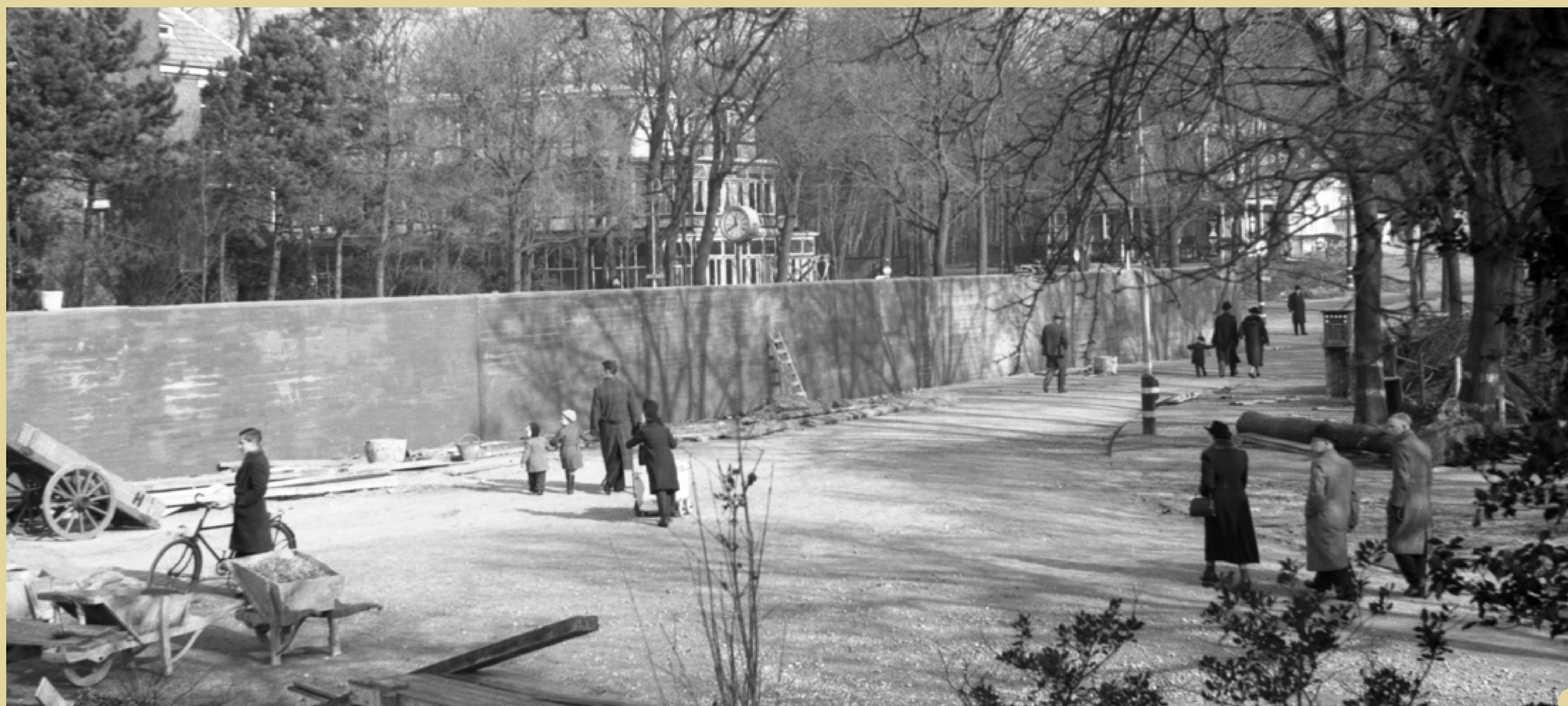
1 Bouw van een anti-tankmuur in het kader van de Atlantikwall C. Looije