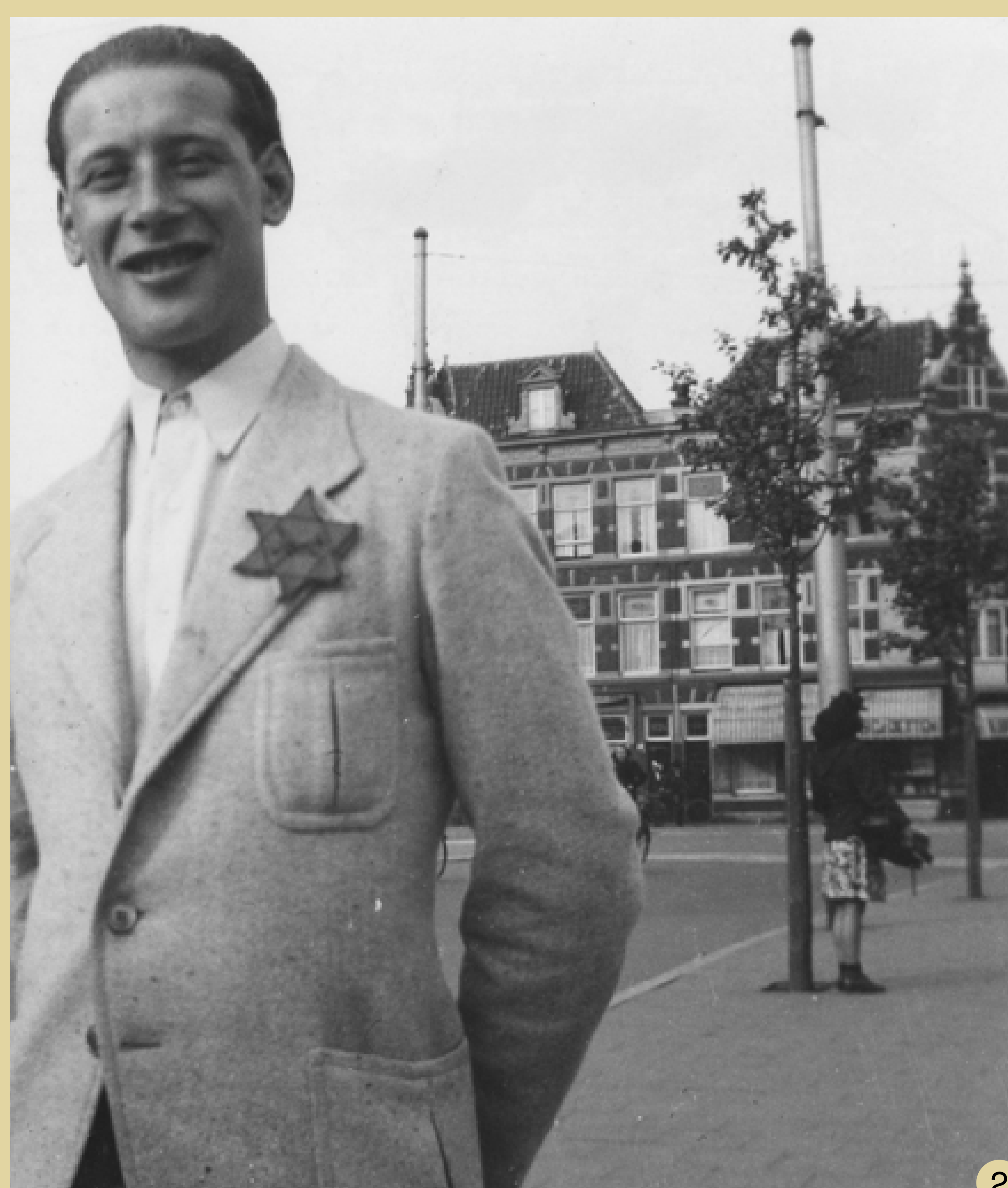
2 Het verplicht dragen van een Jodenster, Hobbemaplein J. J. Duimel