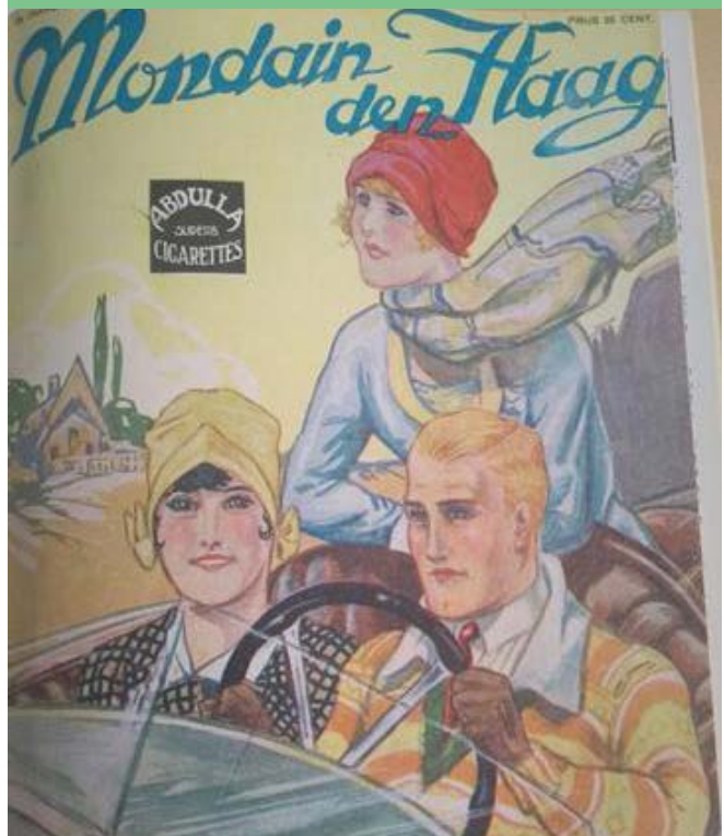
Tijdschrift Mondain Den Haag 1927-1931 (voorzijde van één van de nummers)