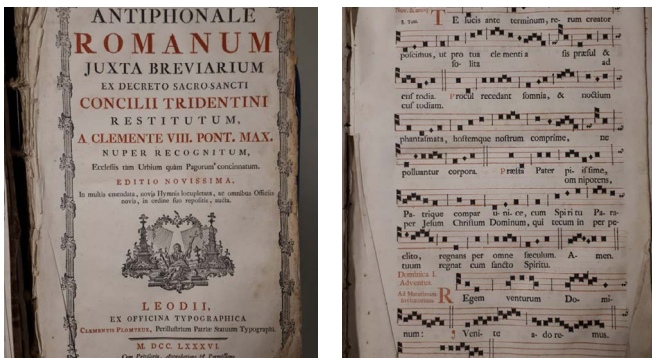
2 afbeeldingen van oude banden Gregoriaanse gezangen: Antiphonale Romanum juxta breviarium ex decreto sacro-sancti concilii tridentini restitutum a Clementi VIII. pont. max., 1786