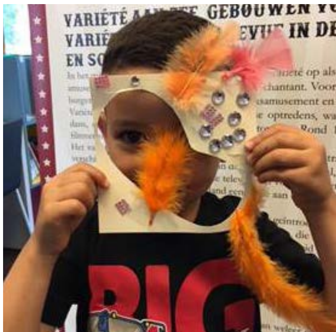
HIP kinderworkshop ‘maskeer je masker’

Zevenentwintig cultuurschakellessen voor het Voortgezet Onderwijs vonden in 2018 plaats. In totaal namen hier 636 leerlingen en 63 begeleiders aan deel. Daarnaast ontving het HGA in mei en december nog 16 leerlingen van het Veurs Lyeum.