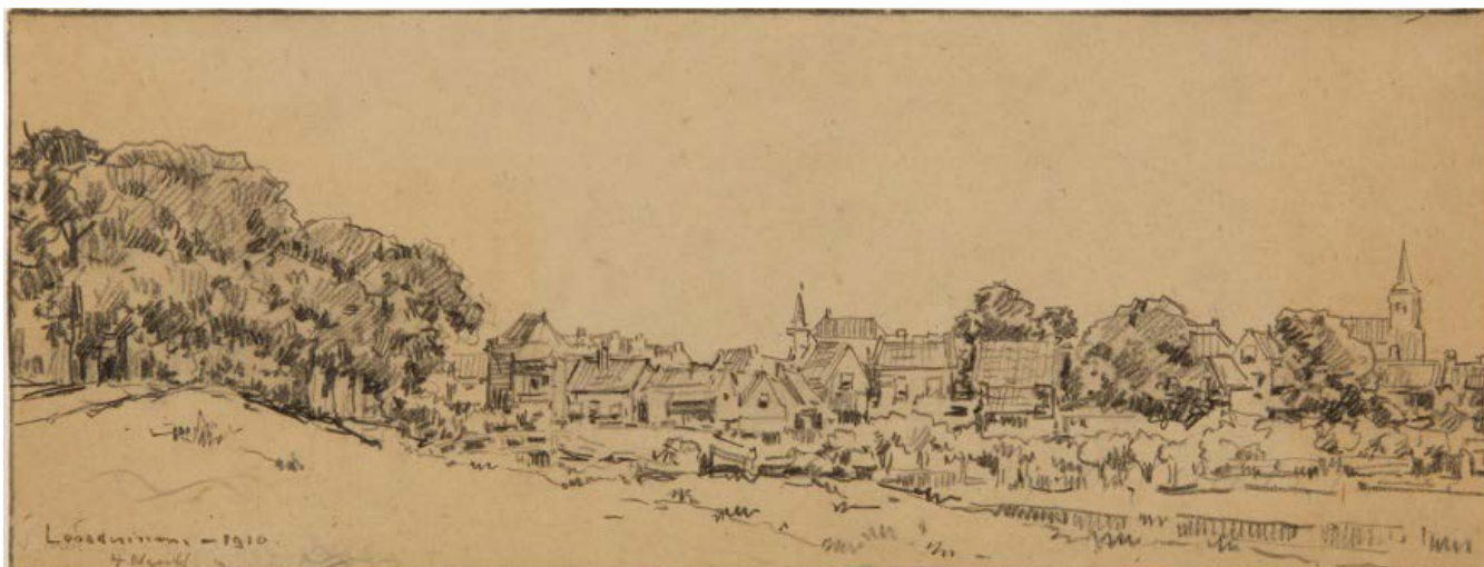
Tekening van Herman Heuff