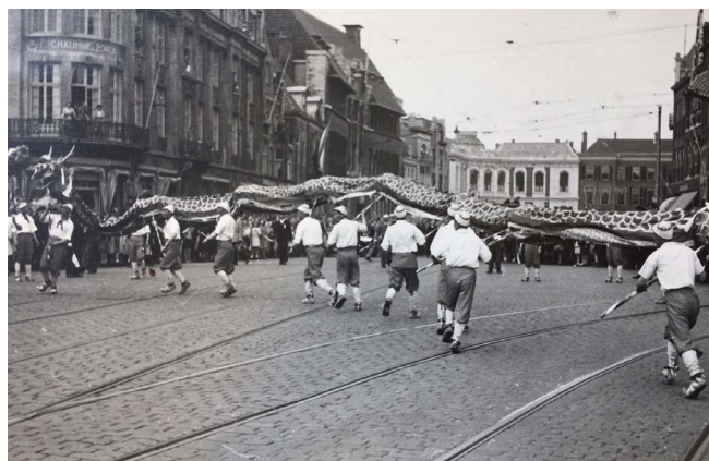
Foto uit het fotoalbum over het Chinese overwinningfeest in Den Haag, gehouden op 4 september 1945

Op de film- en videobank zijn weer diverse filmpjes geplaatst. Voor aanvragers, zoals Omroep West werden compilaties samengesteld. Divers filmmateriaal werd geschonken. Vooruitlopend op de nieuwe website en Beeldbank werd een film- en videomodule aangeschaft, zodat de films en video's in 2019 via dezelfde Beeldbank beschikbaar kunnen worden gesteld.