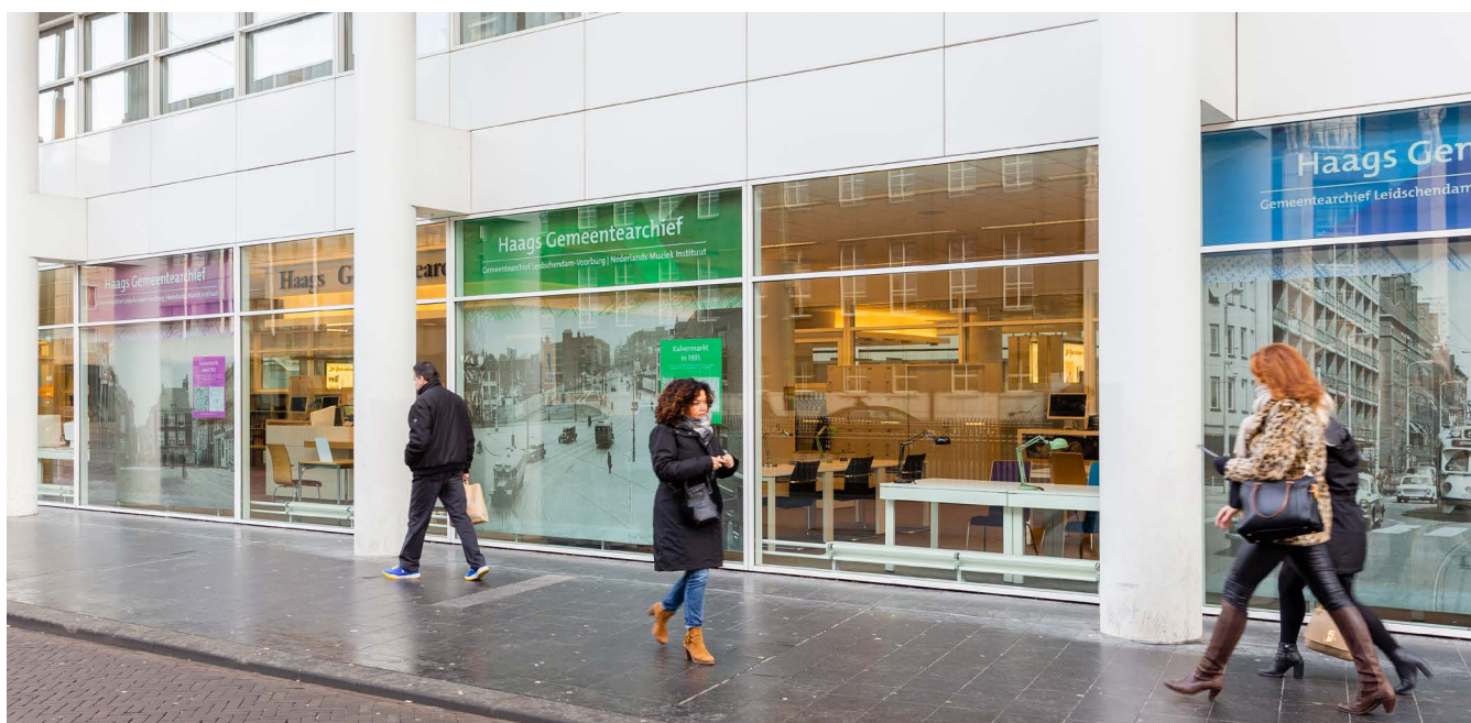
Gevel Haags Gemeentearchief aan de Kalvermarkt, 2018