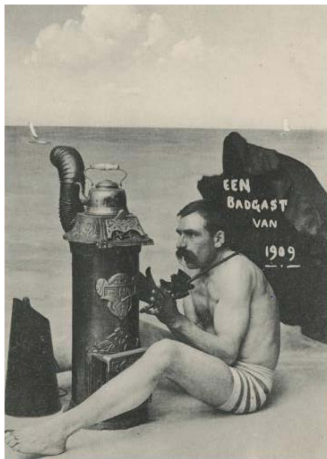
Affiche uit de tentoonstelling: 'Zon zee strand en meer...' in De Galerij