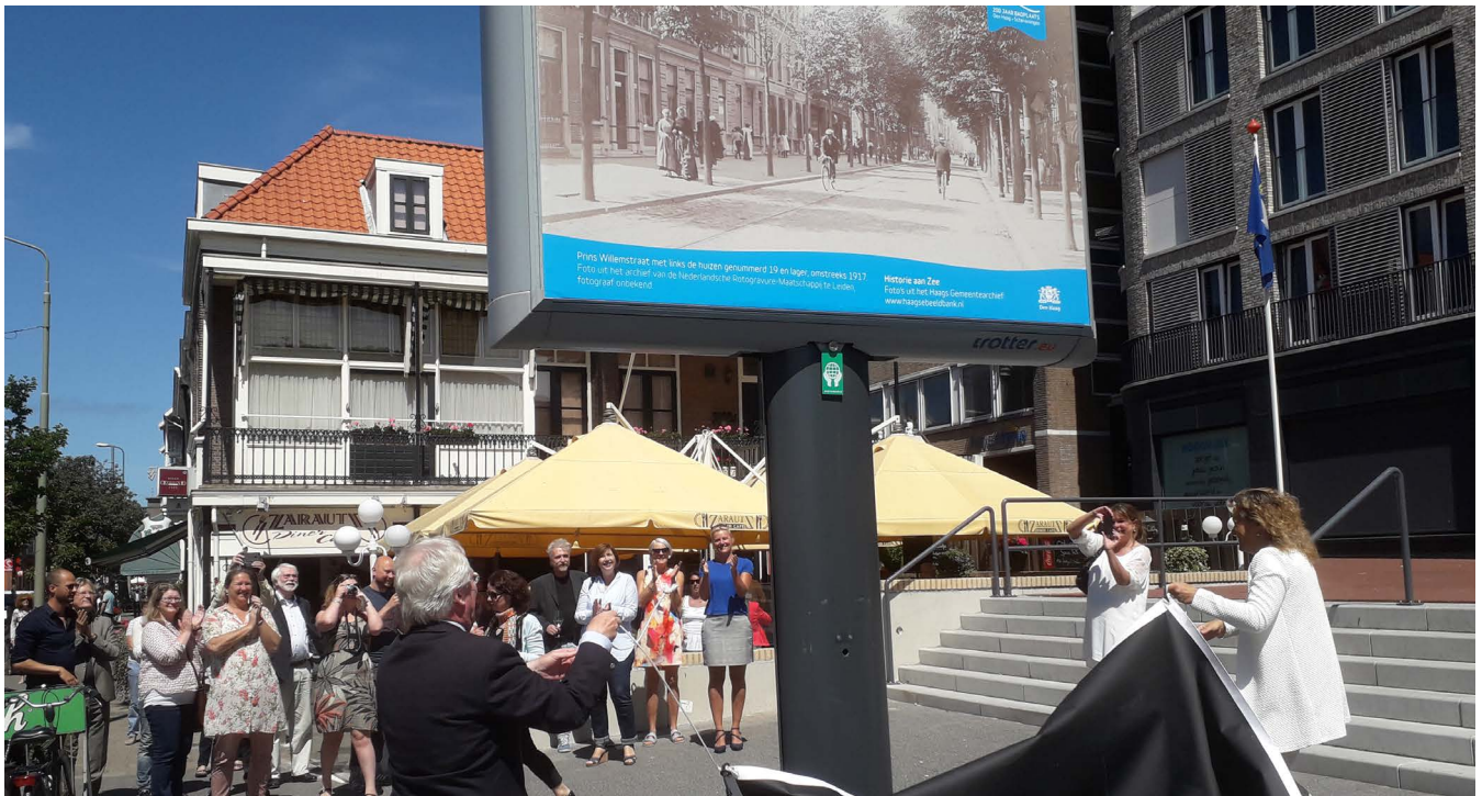
Willemstraat, opening Billboardecollection "Historie aan Zee | foto's uit het Haags Gemeentearchief