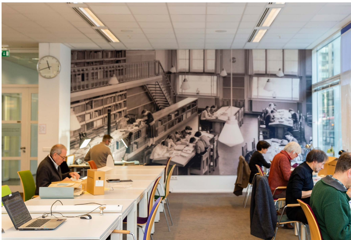
Studiezaal nieuwe look, 2018

De studiezaal onderging een facelift, ging op maandag dicht, maar bleef op de overige weekdays een uurtje langer open voor de bezoekers. De studiezaal is niet alleen zichtbaarder geworden aan de Kalvermarktzijde, maar heeft ook een publieksvriendelijkere uitstraling gekregen, waardoor de drempel voor een bezoek aan de studiezaal is verlaagd. In 2018 werd hard gewerkt aan de bouw van de nieuwe eigen website en aan een nieuwe Beeldbank, die hierin geïntegreerd wordt. De website wordt in 2019 gepresenteerd. Natuurlijk ontbraken dit jaar ook de Dag van de Haagse Geschiedenis, de cultuurmenulessen en de lezingenseries niet. Vele schrijvers, journalisten, publicisten, tentoonstellingsmakers en bezoekers. wisten het HGA te vinden.