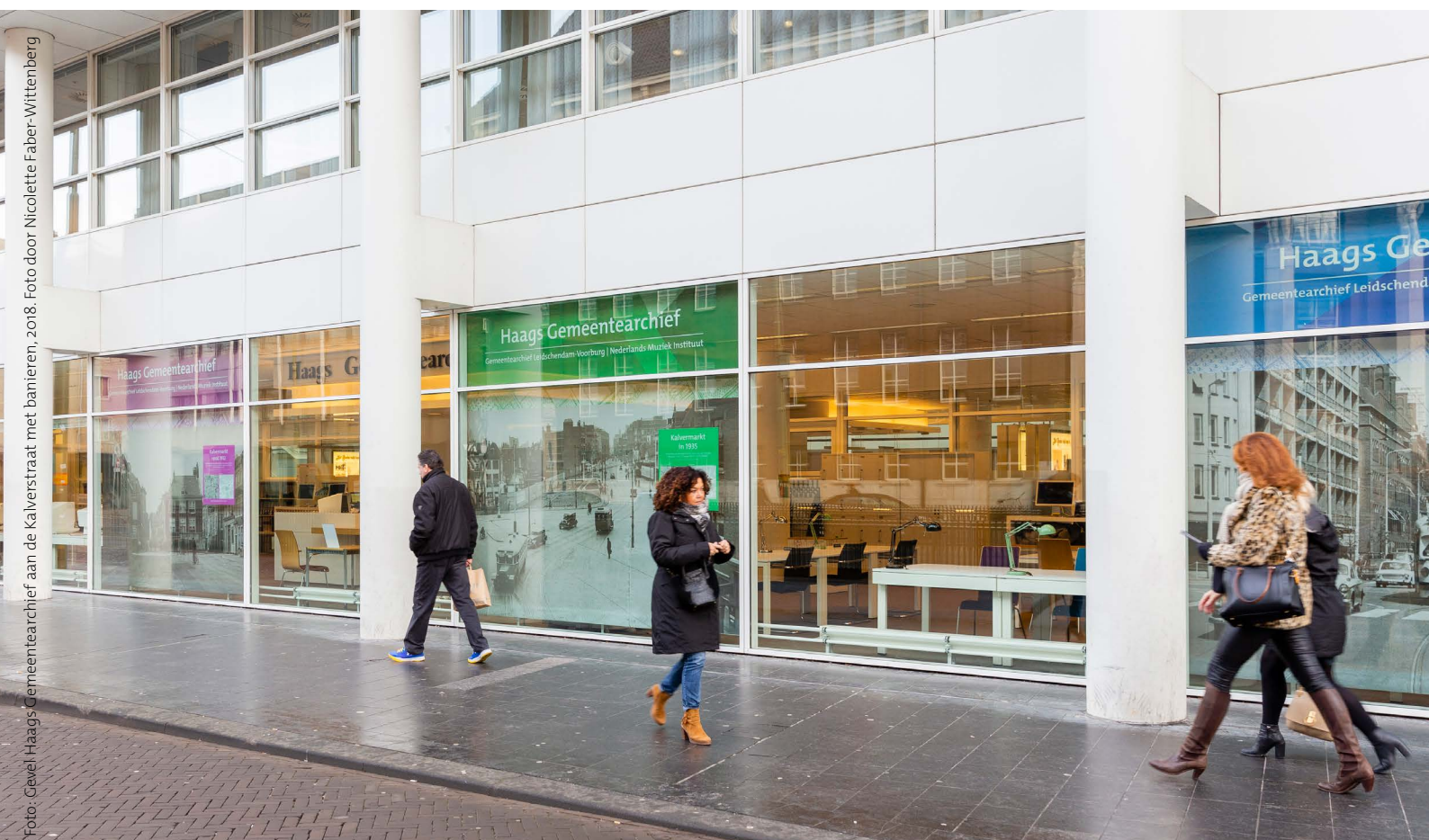
Foto: Gevel Haags Gemeentearchief aan de Kalverstraat met banieren, 2018. Foto door Nicolette Faber-Wittenberg

Gemeentearchief Leidschendam-Voorburg | Nederlands Muziek Instituut