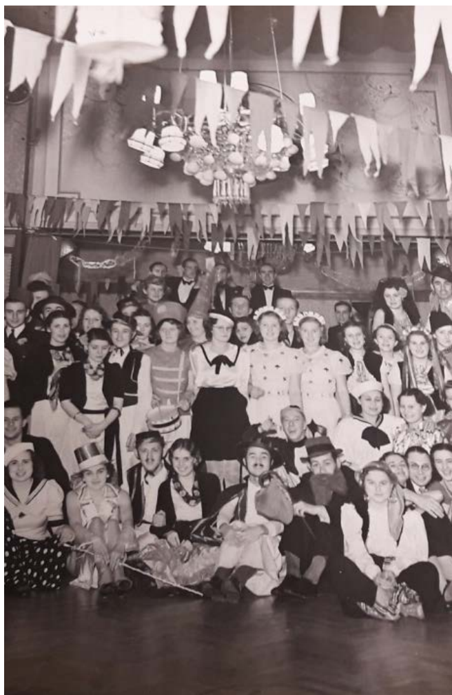
Foto uit het archief van The Night Bachelors Melody Club (detail)

De primaire focus lag op de particuliere archieven. Van deze archieven was vast komen te staan dat hierin de kans op (bijzondere) persoonsgegevens van mensen die mogelijk nog leven, het grootst was. Waar nodig is een openbaarheidsbeperking toegevoegd, of aangepast. Voor de inzage van niet-openbaar archief is een nieuwe procedure gemaakt. Zodra ons collectiebeheerssysteem hierop is aangepast, kan deze geïmplementeerd worden. Niet-openbaar archief dat aan bepaalde voorwaarden voldoet, kan dan gemakkelijker alsnog ter inzage beschikbaar worden gesteld.