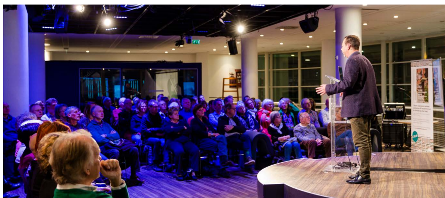
Lunchlezing in de Centrale Bibliotheek, Studio B.