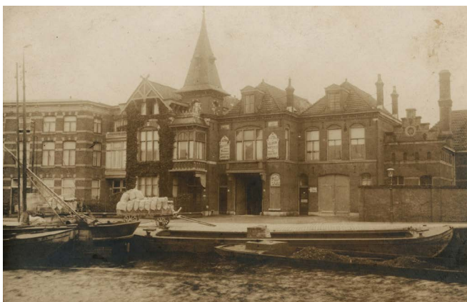
Foto uit de particuliere schenking ontvangen via de VTVA: een handel in bouwmaterialen aan de Trekweg (nu geheten Bontekoekade) rond 1910. Identificatienummer 6.25962, aanwinstnummer 2018/166.

De fotoalbumcollectie is dit jaar aangevuld met achttien albums, waarbij een aanwinst eruit springt. Het betreft een schenking van twee fotoalbums van het Chinese overwinningfeest in Den Haag, gehouden op 4 september 1945. Met dit feest vierde de Chinese gemeenschap veertien jaar verzet en de eindoverwinning op Japan. Het album bevat foto's van de herdenkingsbijeenkomst in de grote zaal van de Haagse diertuin, gevolgd door een feestelijke optocht door de binnenstad. Voor de fotoalbumcollectie is dit het eerste album dat iets van de Chinese gemeenschap in Den Haag laat zien. Samensteller van het album was een van de Chinese organisatoren van het feest.