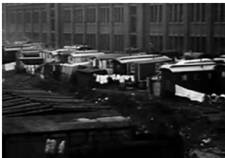
1923, still uit dezelfde film, vanuit 'vogelperspectief'

Zoals in de meeste woonwagenkampen in het land golden ook hier als regels dat de woonwagens van een kenteken voorzien waren - met nummer en plaats van afgifte van de vergunning (bijvoorbeeld de G-932 's Gravenhage en de H-91 Haarlem ) – met huurafdracht voor de standplaats, dagelijkse corvée en boetes bij overtreding.