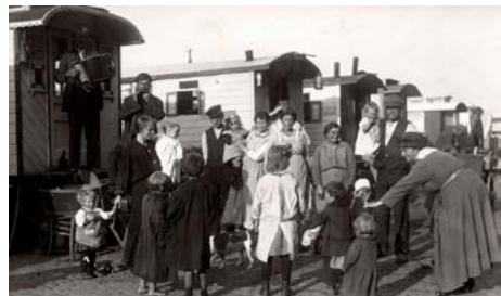
Woonwagenkamp Binckhorsthoek, 1921: de Vereniging Tehuis voor Onbehuisden opent het nieuwe woonwagendorp 45