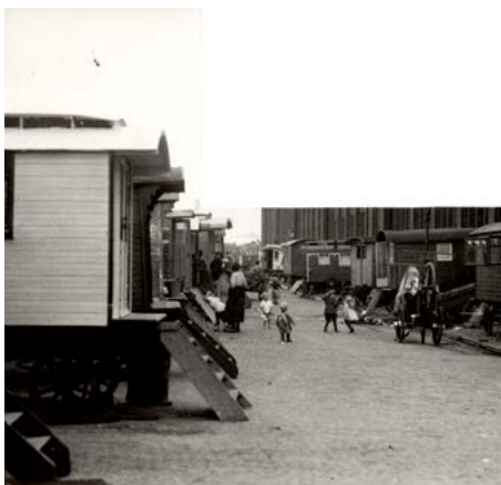
1925, woonwagenkamp Binckhorsthoek 50

Het terrein op de Binckhorstlaan werd in 1925 echter weer gesloten na vragen van de Haagse Huurdersbond in de gemeenteraad en vette krantenkoppen ('Een goelag in de achtertuin', 'Russische toestanden in de Residentie'). Het met aanbouwsels uitgedijde kamp werd opgeheven en de wagens werden verplaatst. Het grootste deel ging richting Loosduinen (Lozerlaan, Escampolder) en een kleiner deel – acht woonwagens van goede gezinnen – naar de Slachthuisgade, achter het openbaar slachthuis (de latere Neherkade). 49 Sommige bewoners trokken echter met de wagen weg of zochten een ander onderkomen in de stad.