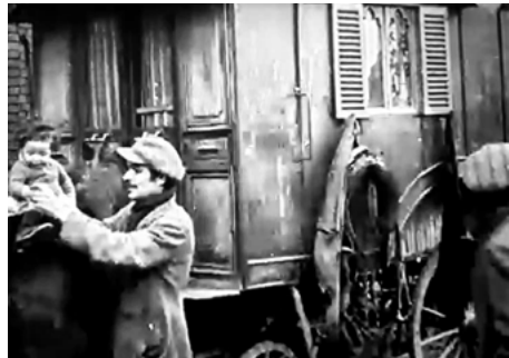
1912: inspectie van paarden en kinderen door het bestuur van de Vereeniging Tehuis voor Onbehuisden. 31