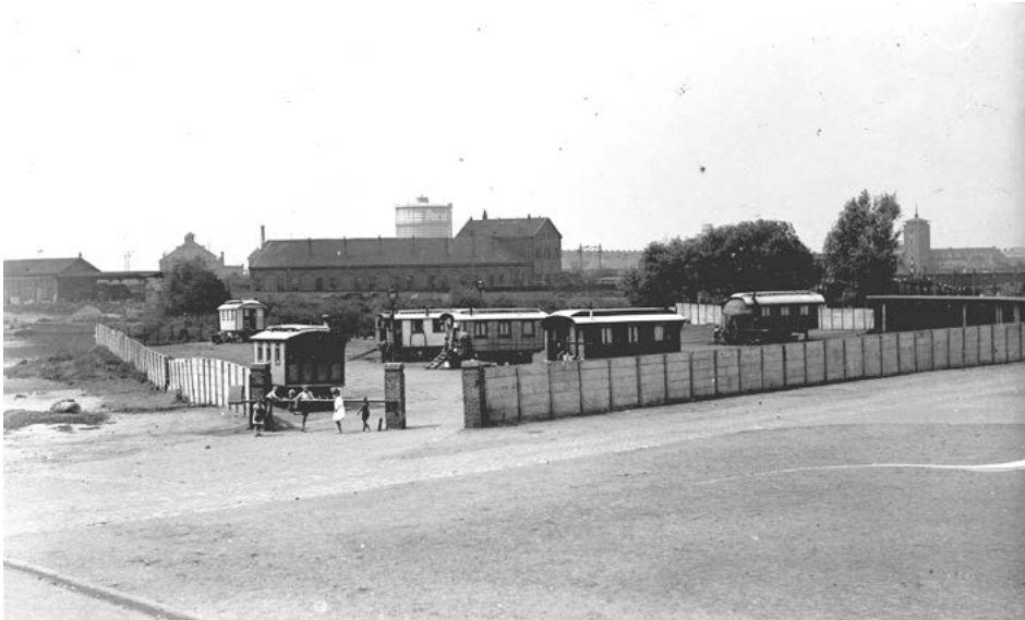
1939: Woonwagenkamp De Siep ('Siberië') aan de Vaaltweg in 's Hertogenbosch. 71