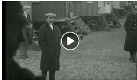
1923, Binckhorsthoek: Genummerde woonwagens, met als kentekens o.a. de G-932 's-Gravenhage en H-91 Haarlem 47

Zoals in de meeste woonwagenkampen in het land golden ook hier als regels dat de woonwagens van een kenteken voorzien waren - met nummer en plaats van afgifte van de vergunning (bijvoorbeeld de G-932 's Gravenhage en de H-91 Haarlem ) – met huurafdracht voor de standplaats, dagelijkse corvée en boetes bij overtreding.