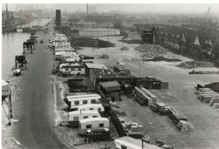
Slachthuisgade (1966), 134