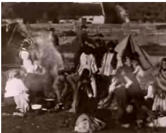
Tentenkamp: still uit de oudste bewegende beelden (1910) 24

Het gezelschap bleek te beschikken over niet alleen contant geld (50.000 Franse franc) en sieraden, maar ook over aanbevelingen van grote fabrikanten uit andere landen. Ook in Den Haag wisten de mannen grote opdrachten binnen te halen, zowel in de particuliere sfeer als in de industriële sector. De koperslagers bleken vakmensen in het vertinnen van bakkerstroggen en ijzeren ketels voor boeren en fabrikanten voor de productie van zuivel, jam en andere voedingswaren. “Hun arbeid bestaat uit vertinnen en koperslaan. Daartoe maken zij een blaasbalg in den grond, dien zij uithollen voor ‘n vuurtje. Zoo ongeveer moeten ook de oude Phoeniciërs en Egyptenaren hun metaal hebben bewerkt. Maar ‘t is er niet minder om wat uit hunne handen komt, want de talrijke orders, die per gewicht worden opgenomen, toonen aan dat zij uitstekende vaklieden zijn” , aldus het artikel in Pak me Mee .