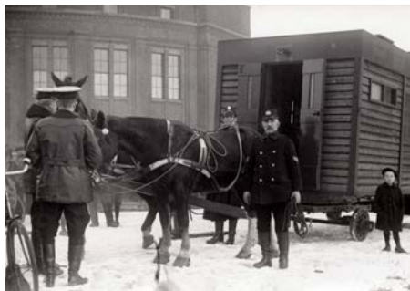
1923: politiepost naar model van de woonwagenschool 48