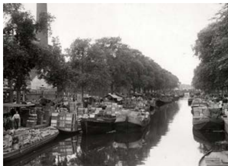
Veenkade bij de Noordwal (Groentemarkt) in 1930