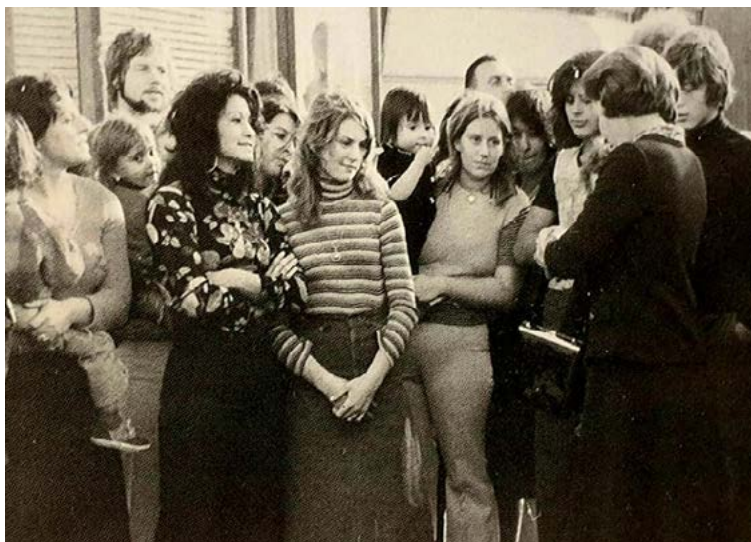
Kroonprinses Beatrix bezoekt woonwagenkamp Fruitweg 162

Hij was in 2004-2010 lid voor Nederland van de Committee of Experts Roma/Travellers (Raad van Europa), publiceert regelmatig over de geschiedenis, cultuur en integratie van Sinti en Roma in Nederland en initieert ook projecten en tentoonstellingen over dit onderwerp.