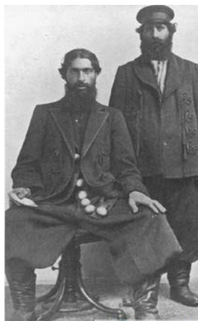
Mannen van de Compagnie Chibalko chaudronnier 25

Het ministerie van Justitie drong er bij de burgemeester van Den Haag op aan om het verblijf van de ketellappers eerder dan december te beëindigen, op grond van “een of andere wet of verordening” , maar de gemeente liet weten geen grond tot ingrijpen te zien, noch van de kant van de brandweer of van de politie, noch van de directie bouw- en woningtoezicht. Het werk van de ketellappers viel namelijk niet onder de Hinderwet, er was formeel geen sprake van een koperslagerij en het vuur diende niet alleen ten behoeve