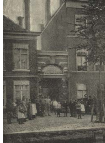
Zuid-oost Buitensingel bij station Staatsspoor, Christelijke Volksbond: Centrum voor ambacht en werkverschaffing 53

Volksbond aan het Westeinde (Kortenbosch) in de hofjesbuurt, en de Vereniging Tehuis voor Onbehuisden in het Regentessekwartier, die niet aan een kerkelijke gezindte was verbonden.