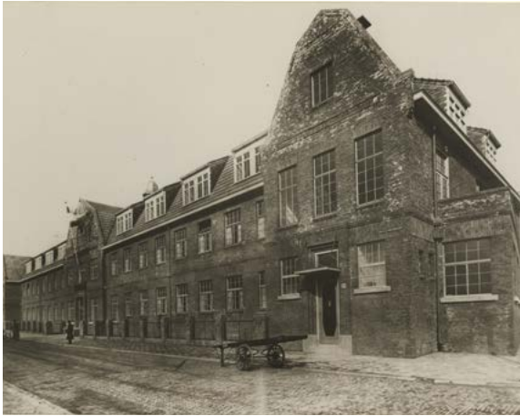
1923: nieuwbouw voor het Tehuis voor Onbehuisden, De La Reykade, vier slaapzalen voor 180 man en twee voor 40 vrouwen met kind 52