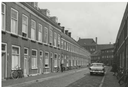
Kortenbos 82 (1961) 135