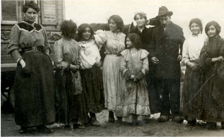
Den Haag, 1912. Fotograaf onbekend. Man, vrouw en kinderen in nieuwe kleren gestoken 32