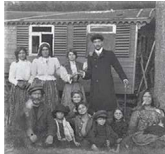
1912, Goirle: familie Gorgan 28