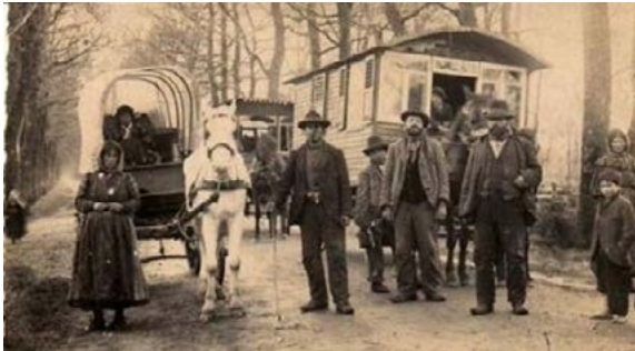
Paardenhandelaren (Lowara): 1905, Staphorsterweg (Meppel-Zwolle) 27

Kort na de ketellappers (Kalderasch) dienden zich paardenkopers (Lowara) aan in Den Haag. Onder deze handelaren bevonden zich zowel Roma als Sinti voor wie de woonwagen zowel tot vervoer als verblijf diende. De Lowara vielen het meeste op qua verschijning, taal, kledij en handelswijze. Net als de Kalderasch reisden ook deze Roma in zogeheten companias waarbinnen familieclans in uitgestrekte territoria opereerden.