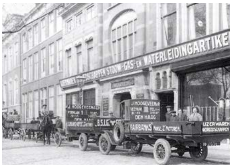
Veenkade nummer 31-35 (1925) 97