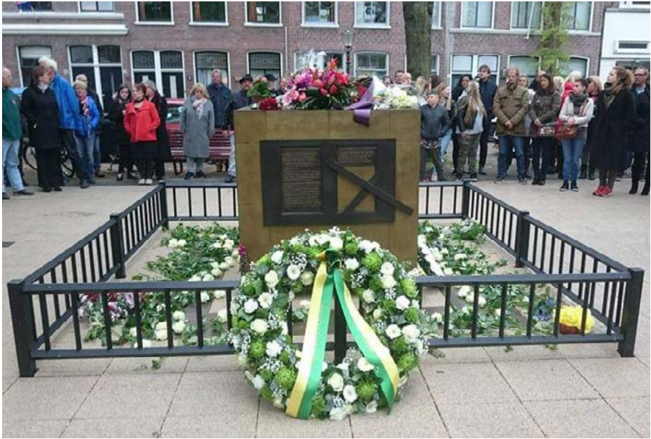
Herdenking bij het Sinti en Roma Monument op het plein bij hoek Vondelstraat – Bilderdijkstraat (19 mei 2019)