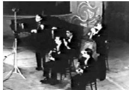
Django Reinhardt en zijn Quintette du Hot Club de France