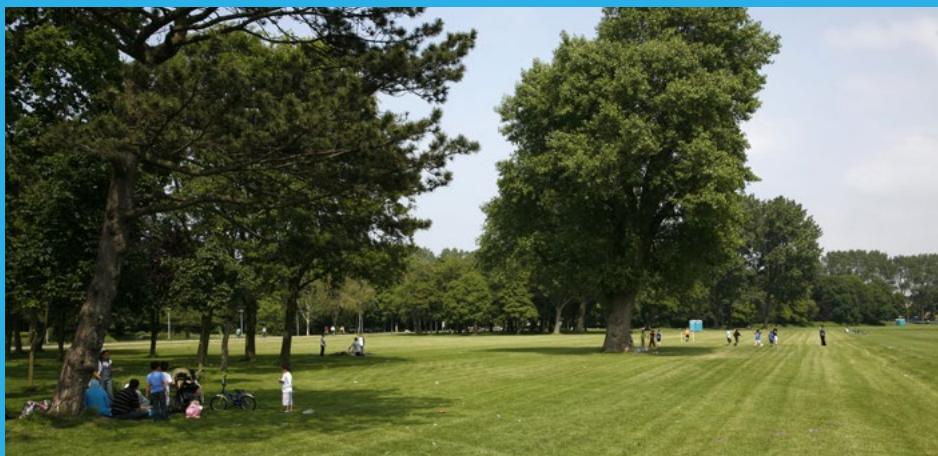
Zuiderpark, 2007 door Dienst Stedelijke Ontwikkeling (Willem Vermeij)

over haar Den Haag; het Zuiderpark en de Haagse Markt