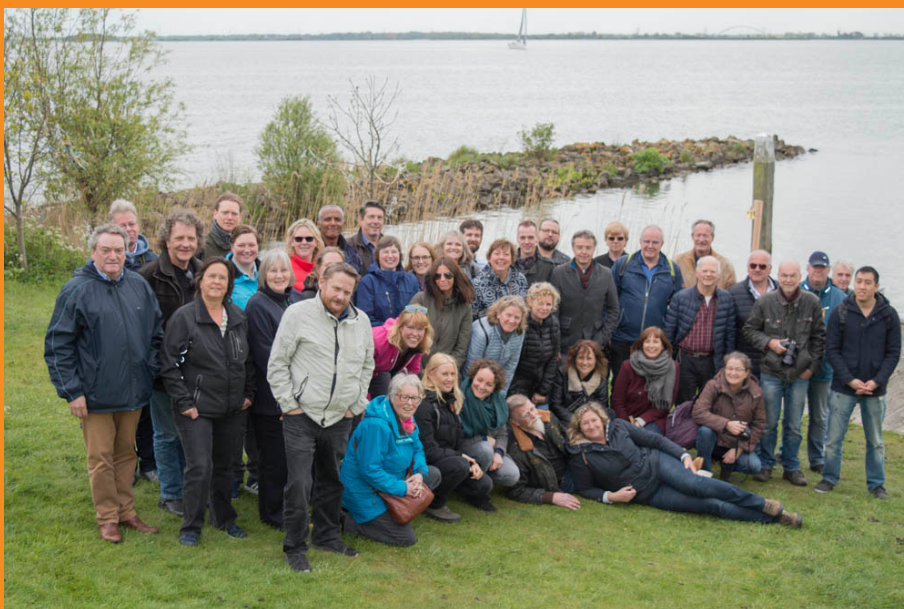
Medewerkers van het Haags Gemeentearchief tijdens het jaarlijks personeelsuitje, 9 mei 2017.

Maar waar we daarin tegen de grenzen oplopen van wat we met onderzoeksgidsen, indexen en andere 'hulpmiddelen' kunnen bewerkstelligen, willen we met een persoonlijke benadering bezoekers op een zo hoog mogelijk niveau van dienst kunnen zijn. Kernwoorden voor het komende jaar zijn daarom: zichtbaar en professioneel .