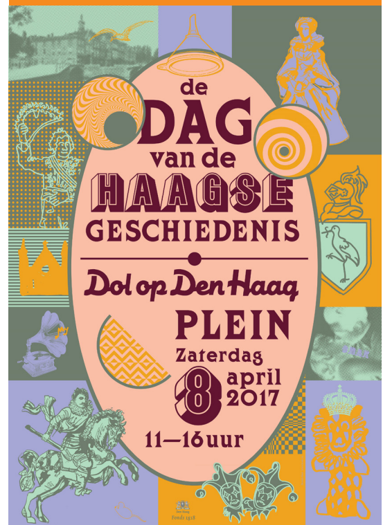
Affiche van de Dag van de Haagse Geschiedenis door Dennis Koot