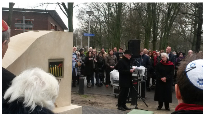
Onthulling van het monument, 2017.

Het HGA was betrokken bij het historisch onderzoek naar de Joodse patiënten en onderduikers die in de oorlogsjaren verbleven in de Haagse psychiatrische instelling Rosenberg. Zij hoopten op die manier uit handen van de bezetter te blijven. Dat lukte echter niet; zij werden via Kamp Westerbork naar de vernietigingskampen in Midden- en Oost-Europa getransporteerd. De meesten van hen overleefden de Holocaust niet. Het verblijf van de Haagse Joden in Rosenberg is lang onbekend gebleven; een toevallige vondst in de archieven van het HGA bracht dit aan het licht. Nader onderzoek in onze archieven hielp om de identiteit van de meer dan 250 personen die dit lot trof, te achterhalen. Op 27 december 2017 werd voor hen op het terrein van de Parnassia Groep aan de Nectarinestraat in Den Haag een monument onthuld. Hun namen worden hierin – digitaal - weergegeven en staan ook in de speciale herdenkingsuitgave De patiënten en Joodse onderduikers bij de Stichting Rosenberg (klinieken Oud-Rosenburg en Ramaer-kliniek) en bij de Stichting Bloemendaal tijdens de Tweede Wereldoorlog (Den Haag 2017).