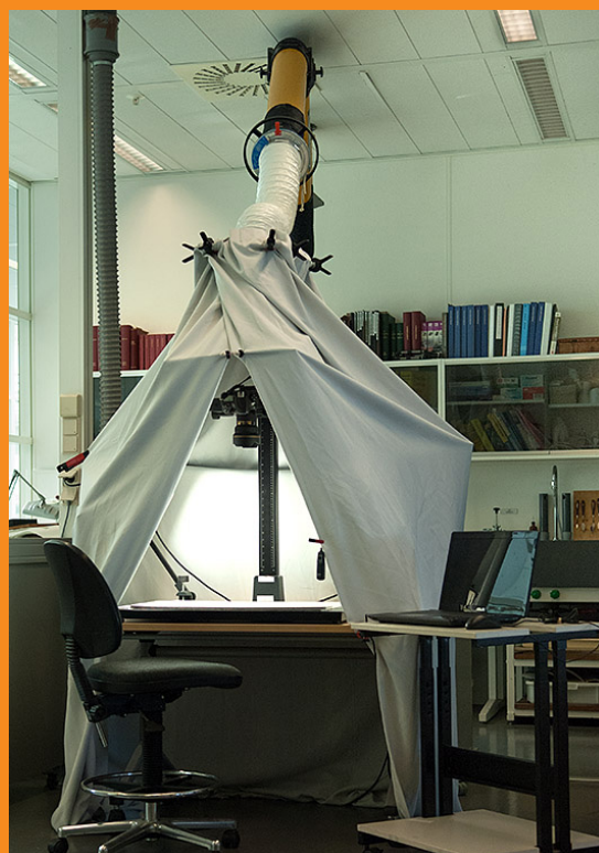
Een fotografische repro-opstelling met lucht-afzuiging, ten behoeve van digitalisering van beschimmelde archivalia, in het restauratieatelier

Team Duurzaamheid (voorheen 'afdeling conservering en restauratie') geeft uitvoering aan conserverende maatregelen in de sfeer van verpakking en berging van archieven en collecties. In 2017 zijn in dat kader diverse archiefstellingen beter geschikt gemaakt voor de berging van boeken. Ook werden zwakke of beschadigde archivalia behandeld om het materiaal fysiek raadpleegbaar te houden, en/of te kunnen digitaliseren. Team duurzaamheid digitaliseert ook zelf op kleine schaal; het gaat dan vooral om bijzondere schadegevallen zoals beschimmeld materiaal. Hiermee kan informatie digitaal raadpleegbaar worden gemaakt zonder dat zeer arbeidsintensieve behandeling van het materiaal nodig is. In het verslagjaar kregen 'de NMI-collecties' extra aandacht; er zijn diverse (bibliotheek)boeken behandeld, en het archief 'Theatre Français' is herverpakt en onderzocht op schades, en (deels) behandeld.