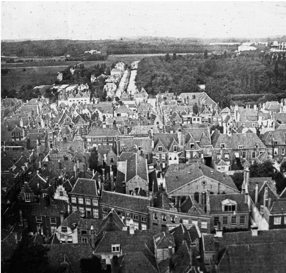
Uitzicht van de toren van de Grote Kerk richting Nobelstraat en Kleine Nobelstraat, Molenstraat en Paleistuin, door Levy & ses Fils, Paris, rond 1865

Van zorgverzekeraar Azivo ontving het HGA het fotoarchief van Azivo en verschillende (andere) onderdelen van Coöperatie De Volharding. Deze collectie, die uiteindelijk naar schatting ruim 1.500 foto's uit de periode circa 1900-2000 zal tellen, wordt geleidelijk aan toegevoegd aan de Haagse beeldbank.