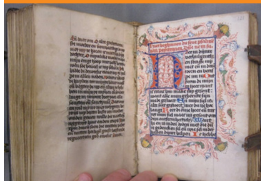
Handschrift uit de collectie van de bibliotheek

Boeken gemeentearchief Leidschendam-Voorburg, schenkingen 4