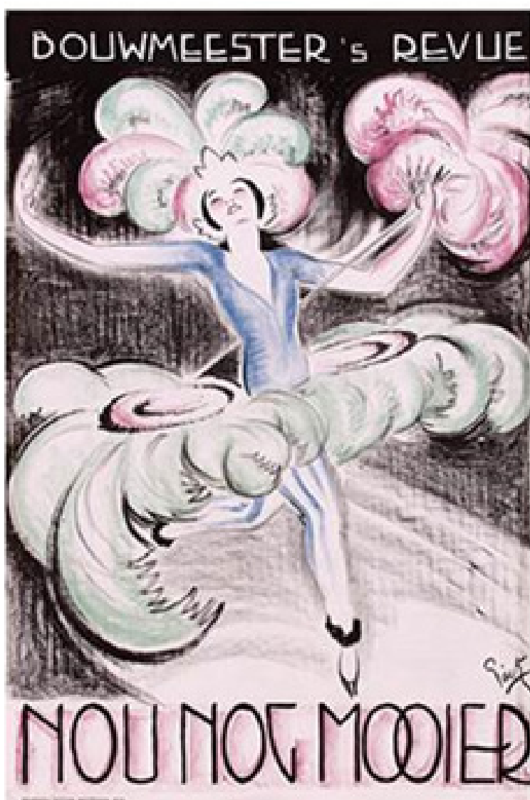
Affiche uit de collectie

In 2017 is een deel van de beschrijvingen die momenteel alleen in de studiezaal in mappen te vinden zijn, gekopieerd van Word naar het collectiebeheersysteem Mais-Flexis. Er is een begin gemaakt met het ompakken en uitgebreider beschrijven van de collectie Schildersbrieven; komend jaar zal deze collectie volledig beschreven moeten zijn om in aanmerking te komen voor een subsidie waarmee ze gedigitaliseerd kunnen worden (Metamofoze). Ook kwam er een aantal schenkingen binnen.